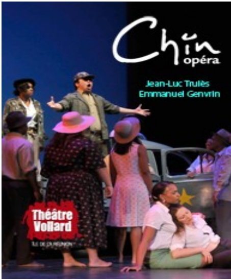
Troupe Volland Et Théâtre Volland