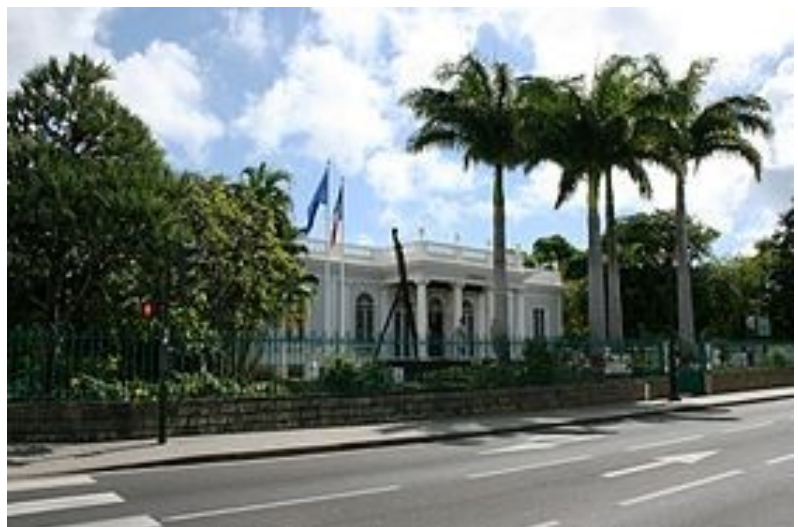
Musée Dierx à Saint-Denis