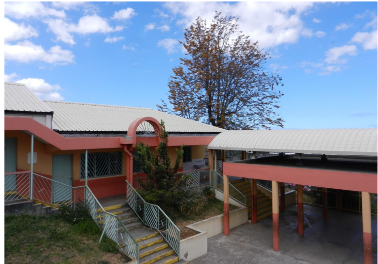
Ecole Ambroise Volland de Saint-Pierre