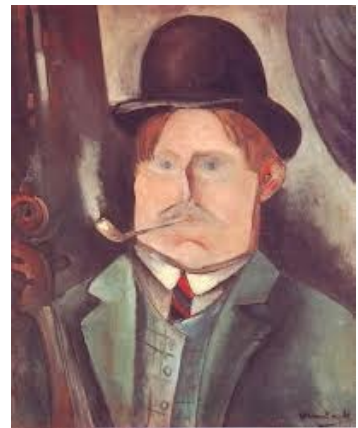
Maurice de Vlaminck