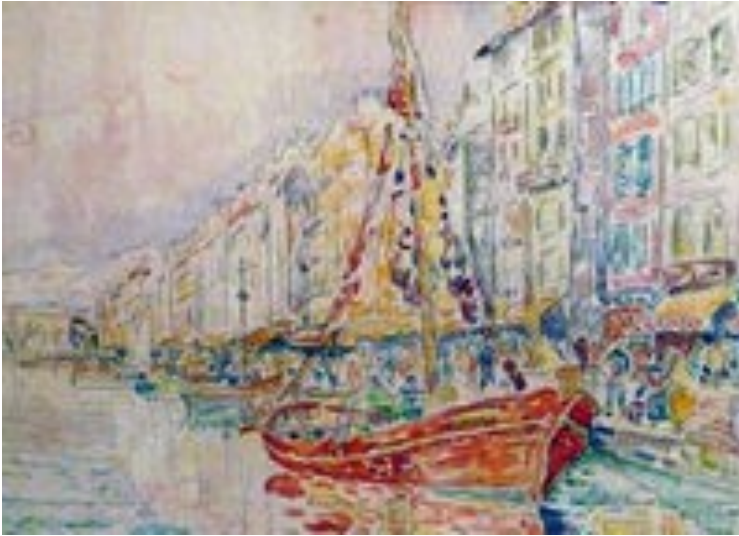
Le Vieux-port de Marseille

Paul Signac (1863-1935) est un peintre français qui a mis au point la technique du pointillisme .