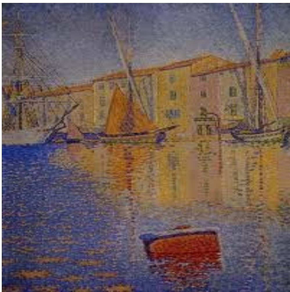
Paul Signac « Saint-Tropez, la bouée rouge »

A la découverte de Paul Signac et de l'impressionnisme