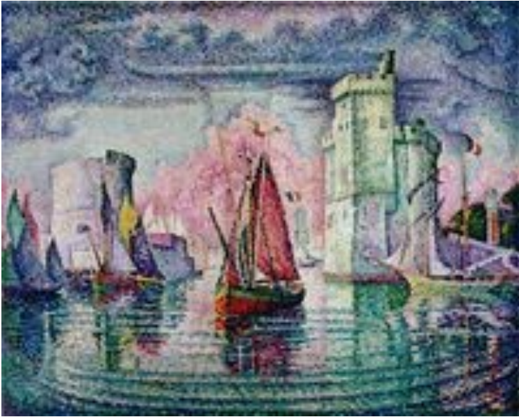
Entrée du port de La Rochelle , 1921