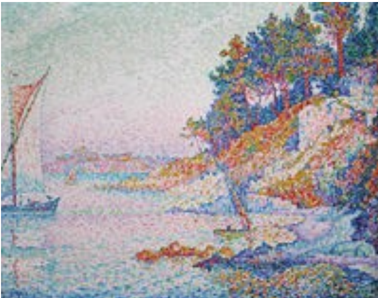
La Calanque, 1906.