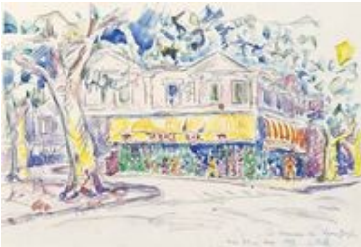
La Maison de Van Gogh à Arles , 1933.

Le pointillisme (ou néo-impressionnisme ) est un courant artistique issu du mouvement impressionniste qui consiste à peindre par juxtaposition de petites touches de peinture de couleurs primaires ( rouge , bleu et jaune ) et de couleurs complémentaires ( orange , violet , vert ).