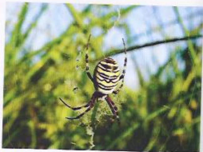
D Une araignée.