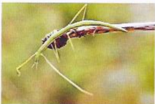
G Un phasme.

→ L'aspect des êtres vivants est adapté à leur environnement pour des raisons alimentaires, climatiques ou de protection.