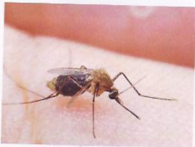
C Un moustique.