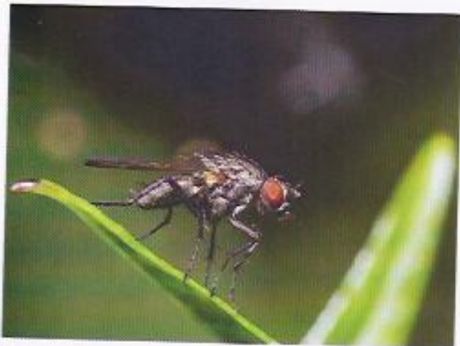
A Une mouche.

Ces quatre animaux ont certains caractères physiques en commun, mais font partie d'espèces différentes.