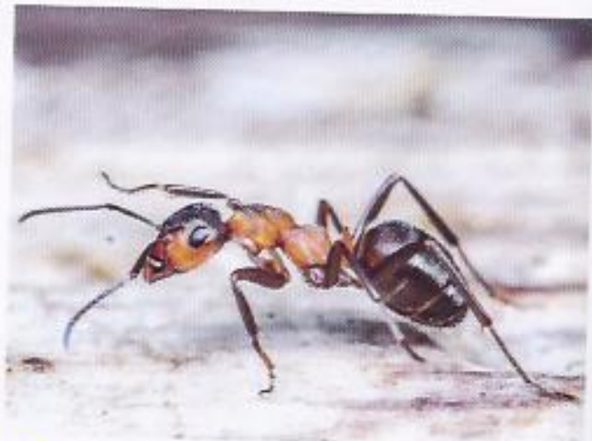
B Une fourmi.