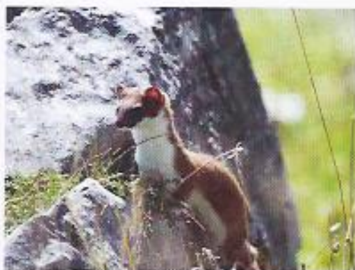
F Une belette.