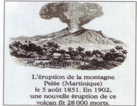
L'éruption de la montagne Pelée (Martinique) le 5 août 1851. En 1902, une nouvelle éruption de ce volcan fit 28 000 morts.

De grosses coulées de lave détruisent tout sur leur passage – comme ce village qui se dressait autrefois au bout de cette route, près du volcan du mont Kilauea, à Hawaii.