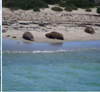
SEA LIONS (lions de mer)