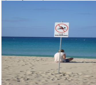
NO SWIMMING because of SHARKS !!!