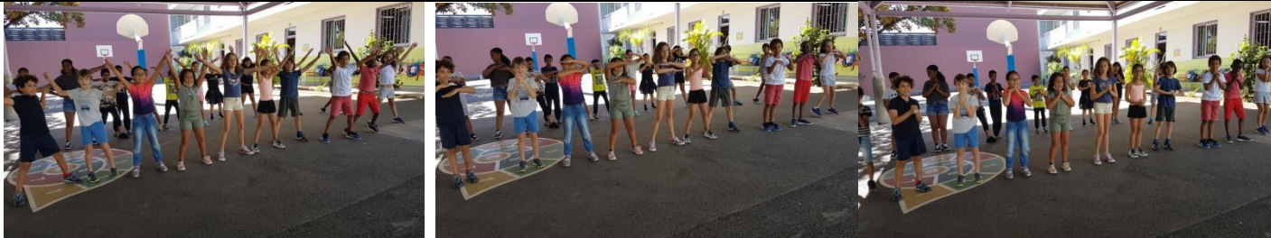
Chant : Liberté, égalité, fraternité