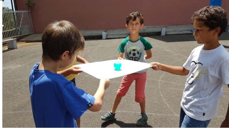
Activités de coopération avec les CE1 b