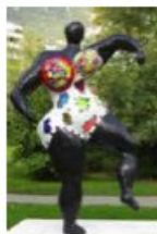
Niki de Saint Phalle