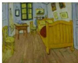
Vincent Van Gogh