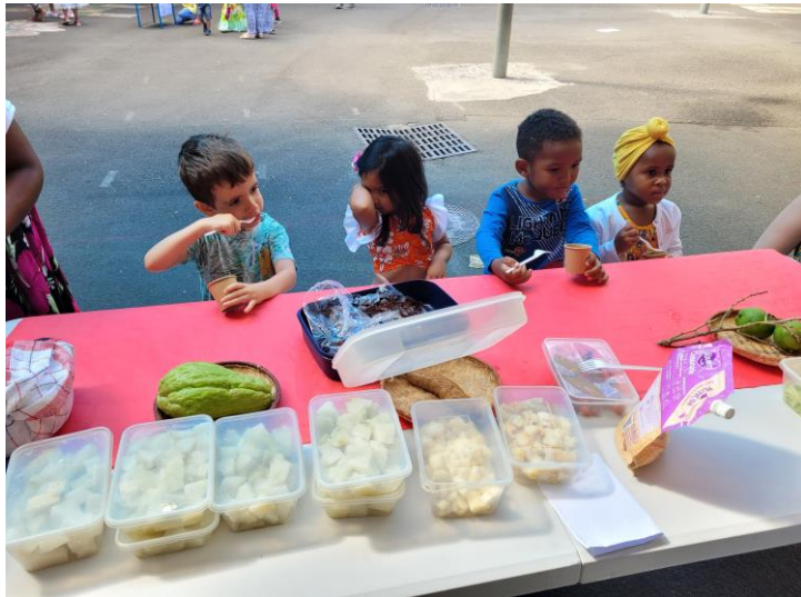
Chouchou, manioc, mangue