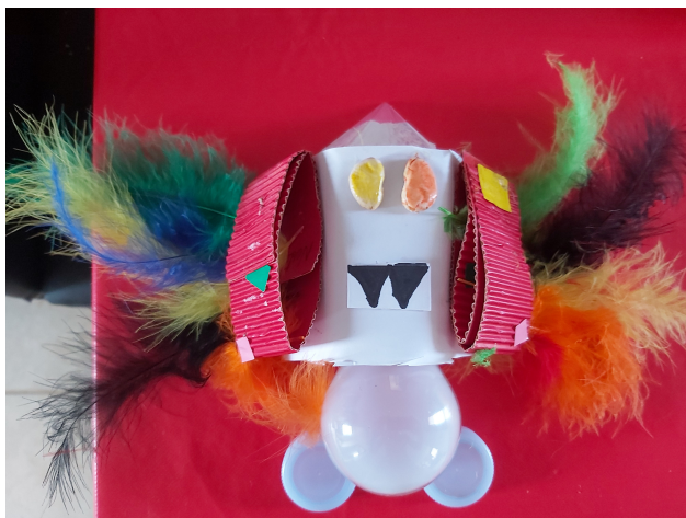
Monstre de Nesta