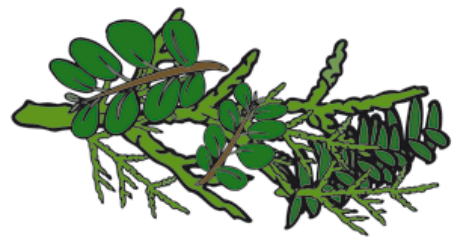
Taille de haie

Les encombrants regroupent les vieux meubles ( fauteuils – chaises –étagères matelas et petits appareils électroménagers. – gros jouet)