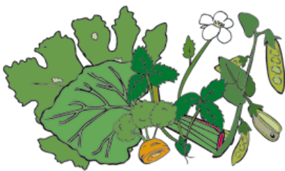
Plantes du jardin