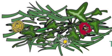
Tonte de pelouse