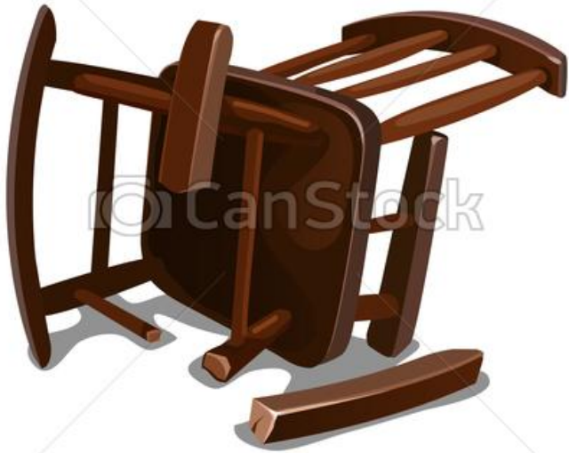
UNE CHAISE CASSEE (CASSER) Casser un objet, c'est le mettre en morceaux.

Le parent découpe les images du lexique avant de commencer de faire décrire et nommer les mots de l'histoire « Boucle d'or et les trois ours ».