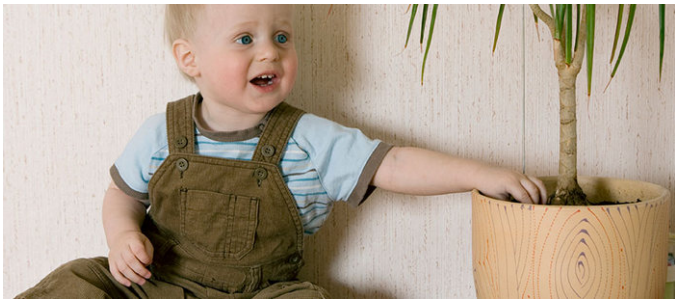
TOUCHER C'est mettre la main sur un objet.