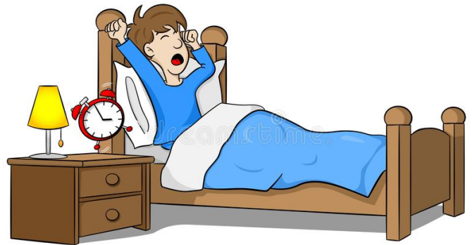
IL OU ELLE SE REVEILLE (SE REVEILLER) C'est arrêter de dormir.