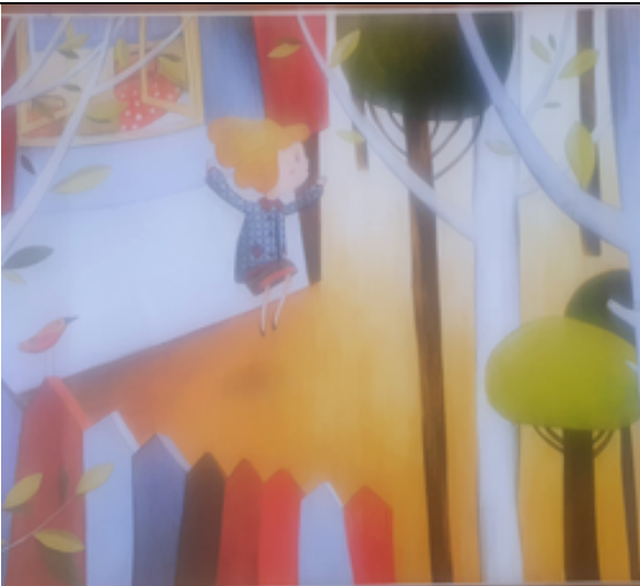
ELLE SE SAUVE (SE SAUVER) C'est s'enfuir pour échapper à quelque chose ou à quelqu'un.