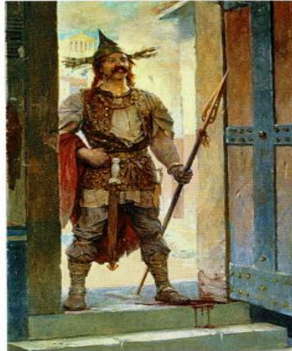
Détail d'une peinture de Paul Joseph Jamin, Brennus et sa part de butin , 1893 (musée des Beaux-Arts de La Rochelle, Charente-Maritime).