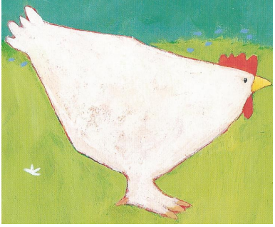
LA POULE « Paulette »