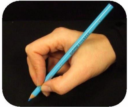
Le haut du crayon est posé dans le creux entre le pouce et l'index.