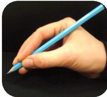
Majeur sur le crayon