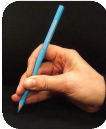
Tous les doigts au dessus et le pouce en opposition