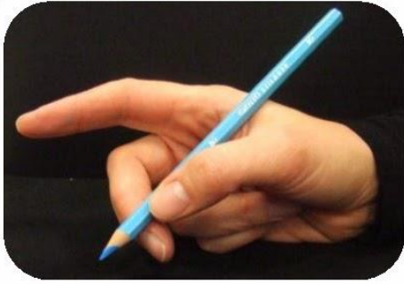
Ce n'est pas l'index qui pince, il dirige.