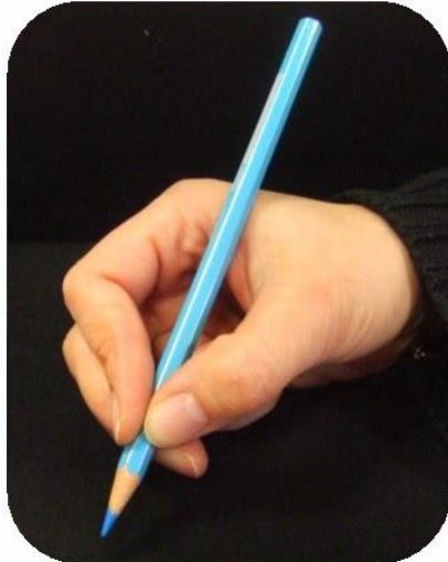
Le crayon est posé sur la première phalange du majeur.