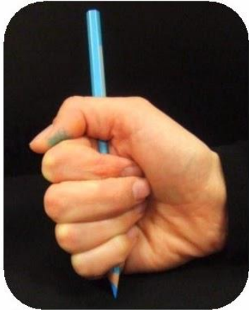
Crayon tenu par tous les doigts