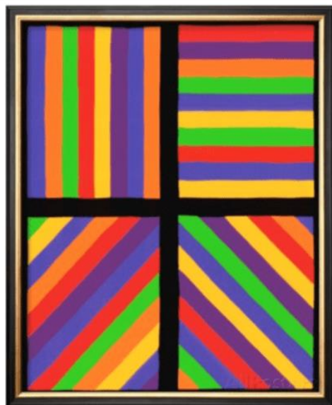
Color Bands in Four Directions Sol Lewitt, 1999.