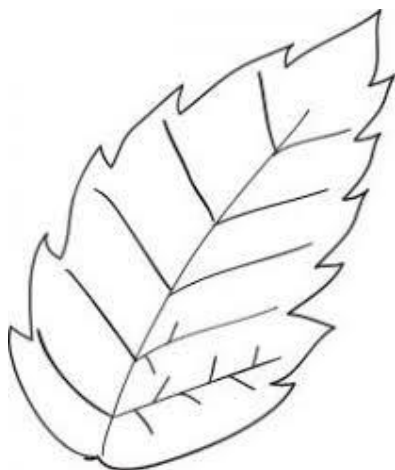
Nervures d'une feuille

Réaliser des graphismes décoratifs en employant le tracé oblique/ la ligne brisée.