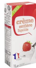
la brique de crème fraîche