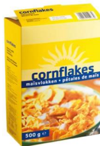
le paquet de céréales