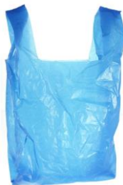
le sac plastique