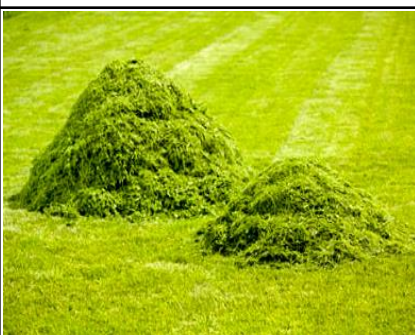
la tonte de gazon