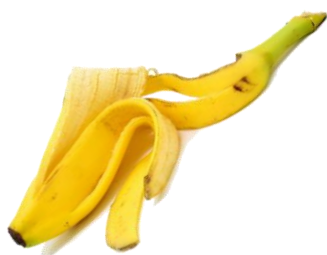
la peau de banane