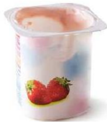
le pot de yaourt