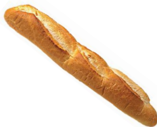
le pain rassis