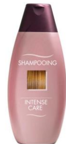
le flacon de shampooing