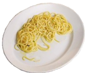
les restes de pâtes