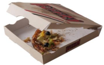
la boîte à pizza