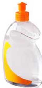
le flacon de liquide vaisselle