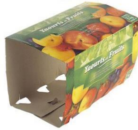
le carton de suremballage