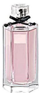
le flacon de parfum