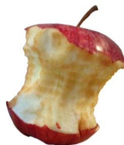
le trognon de pomme