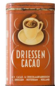
la boîte métallique