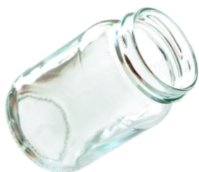
le bocal en verre