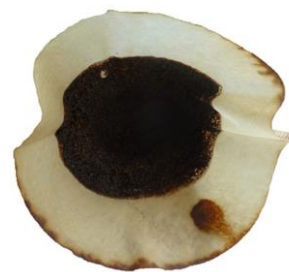
le marc de café