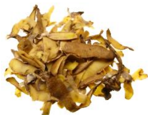
les épluchures de pommes de terre