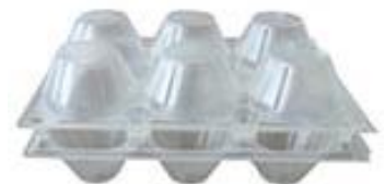
la boîte d'œufs en plastique