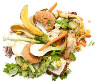
les restes de repas