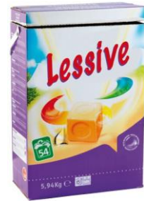
le baril de lessive