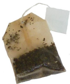
le sachet de thé