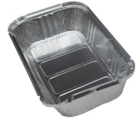
la barquette en aluminium