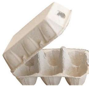
la boîte à œufs