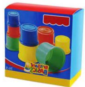
la boîte en carton