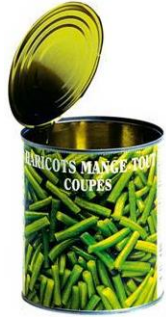
la boîte de conserve