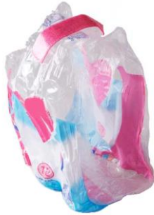
l'emballage en plastique