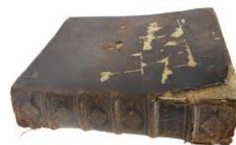
le vieux livre