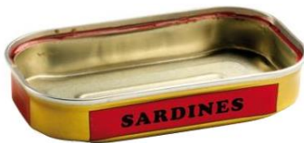
la boîte de sardines