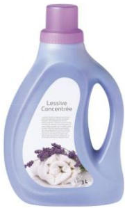
le bidon de lessive