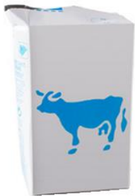
la brique de lait