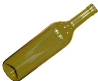
la bouteille en verre