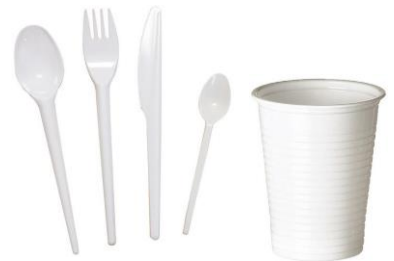
la vaisselle en plastique