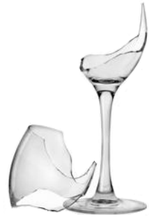
le verre cassé