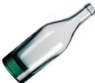
la bouteille en verre