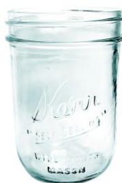
le bocal en verre