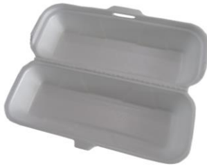
l'emballage en polystyrène