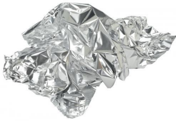
le papier d'aluminium