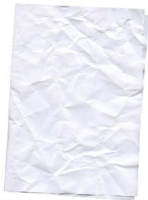
les feuilles de papier