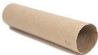
le rouleau de sopalin