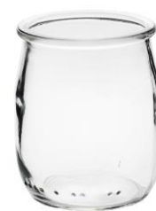
le pot de yaourt en verre