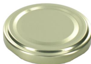
le couvercle en métal