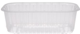
la barquette alimentaire