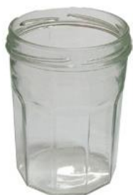
le pot à confiture