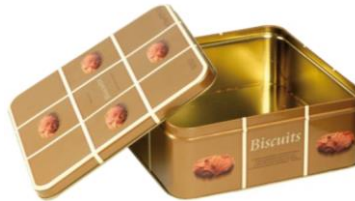
la boîte de biscuits métallique