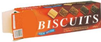
le paquet de biscuits