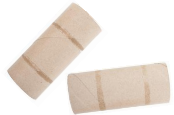
les rouleaux de papier toilette