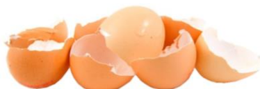
les coquilles d'œufs