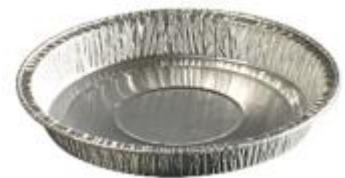
le plat en aluminium