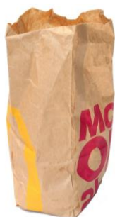
le sac en papier