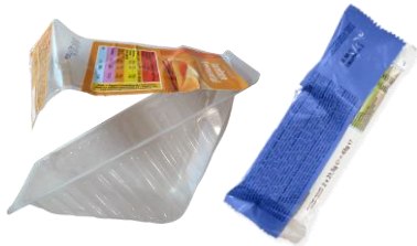
les emballages alimentaires souillés