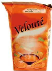
la brique de soupe