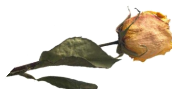
la fleur fanée