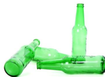
les bouteilles de bière