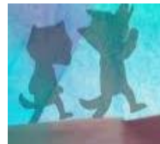
Les ptis loups du jazz