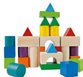
jeux de construction