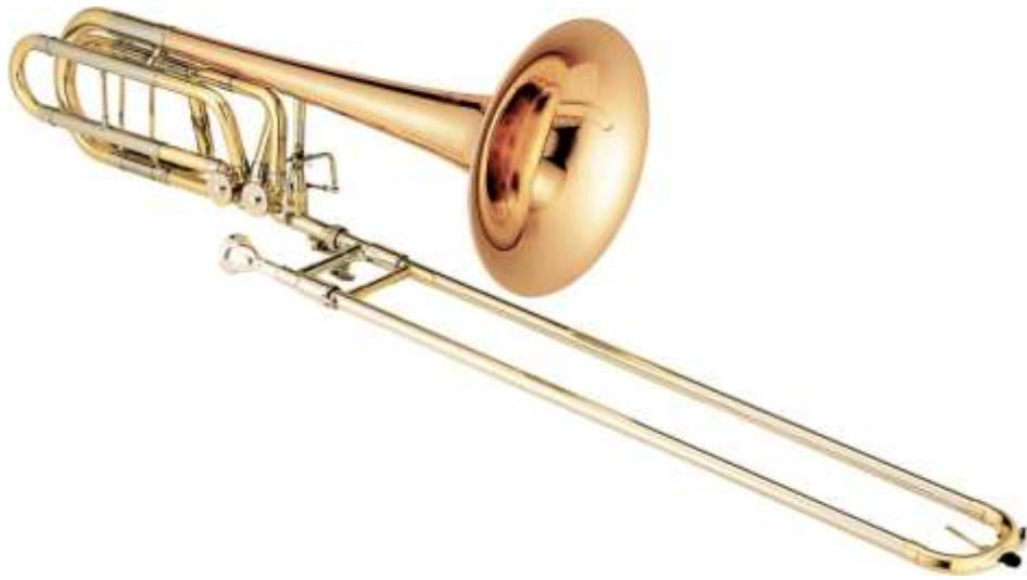
TROMBONE trombone trombone