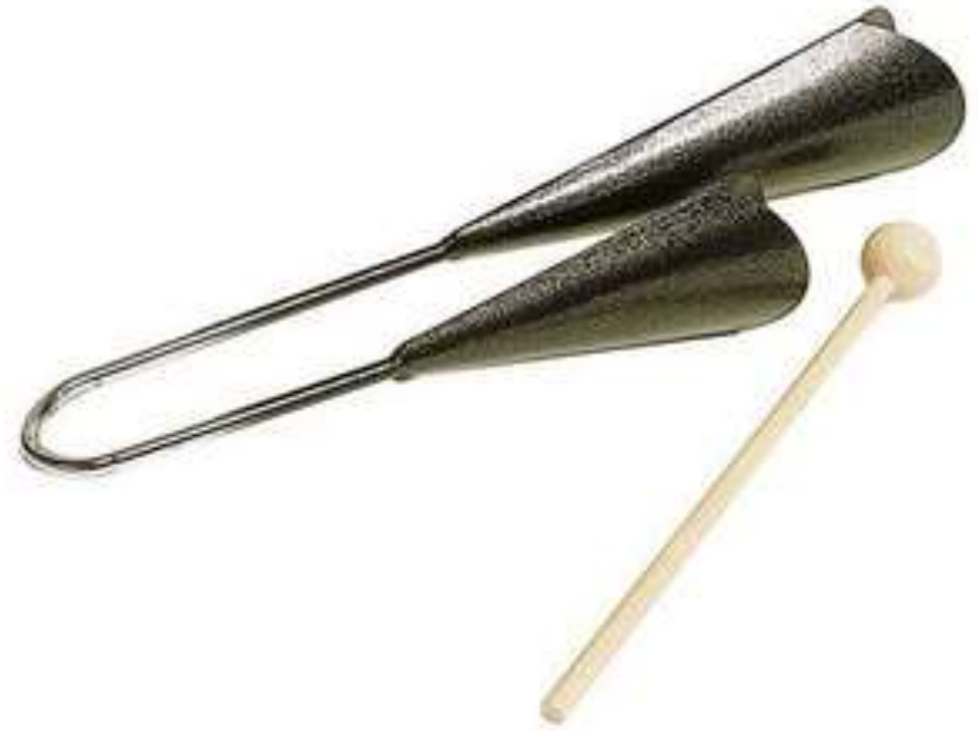
CLOCHE BRESILIANNE cloche brésilienne cloche brésilienne