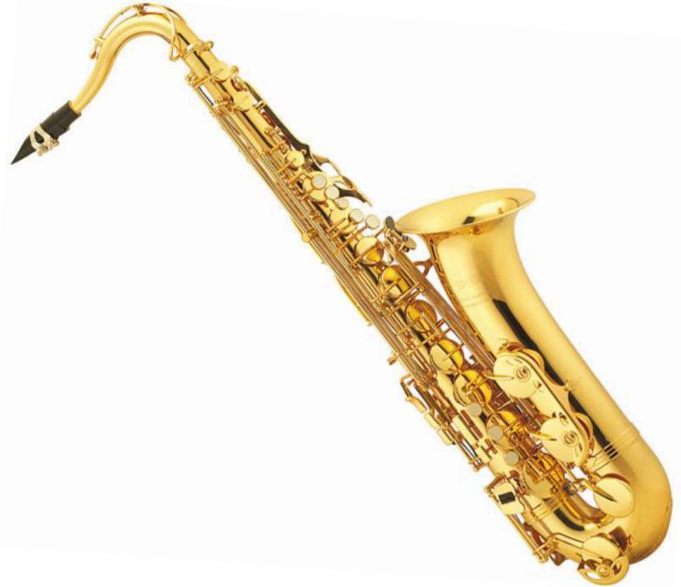
SAXOPHONE saxophone saxophone