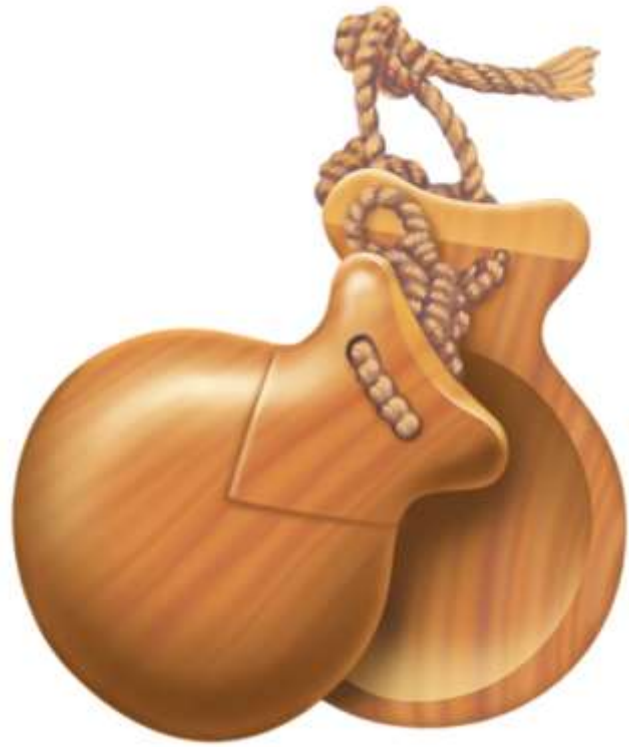
CASTAGNETTES castagnettes castagnettes