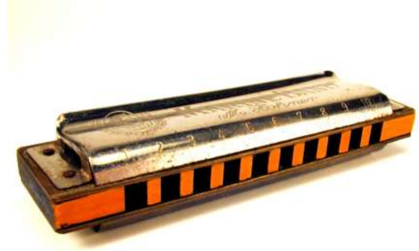
HARMONICA harmonica harmonica