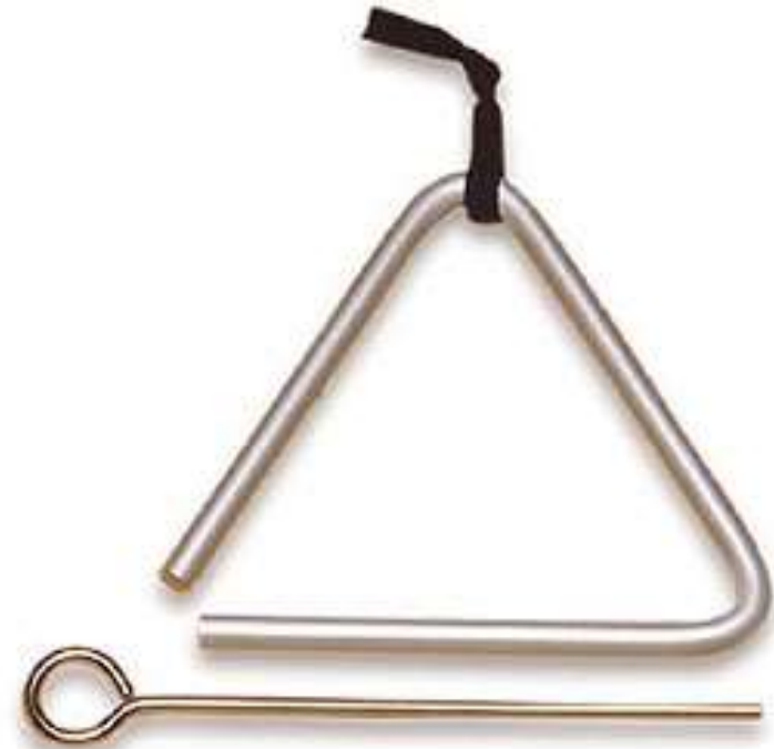
TRIANGLE triangle triangle