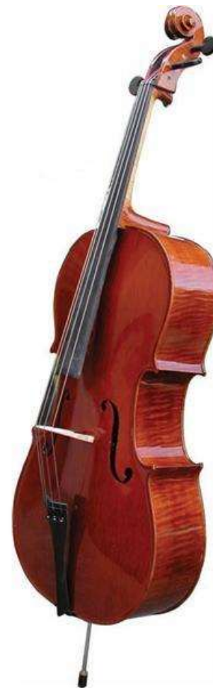
VIOLONCELLE violoncelle violoncelle