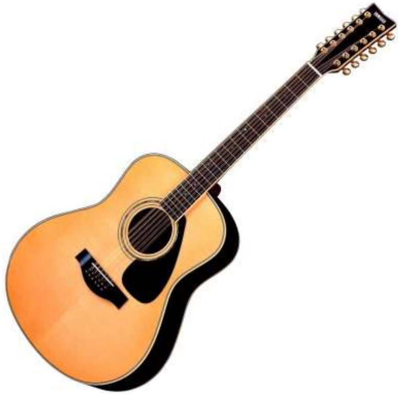
GUITARE guitare guitare