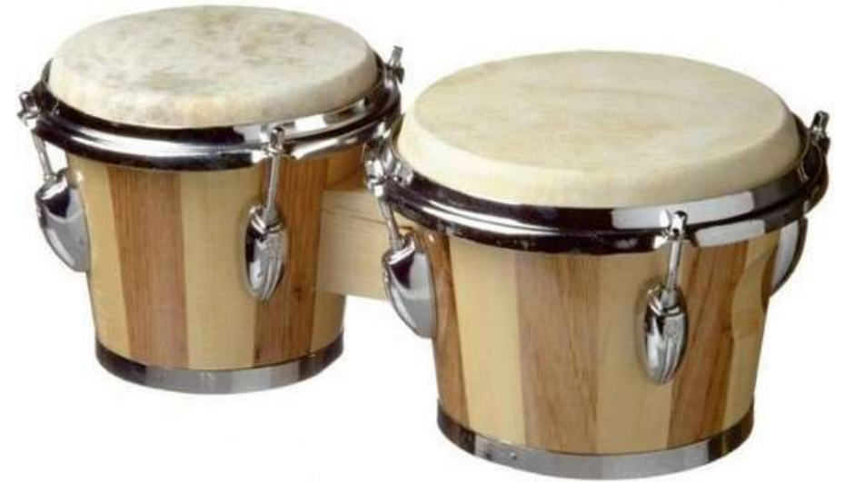
BONGO bongo bongo