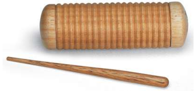
GUIRO güiro güiro