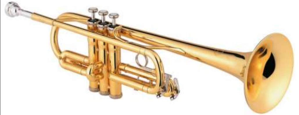
TROMPETTE trompette trompette