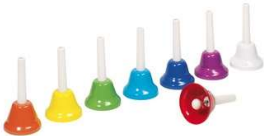
CLOCHETTES clochettes clochettes