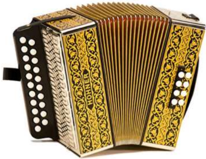
ACCORDEON accordéon accordéon