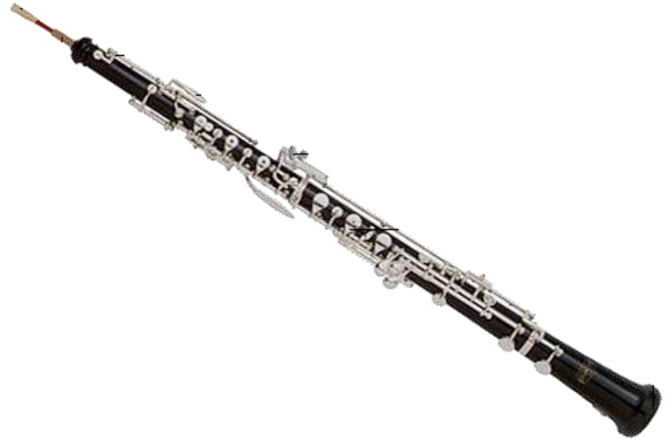
HAUTBOIS hautbois hautbois