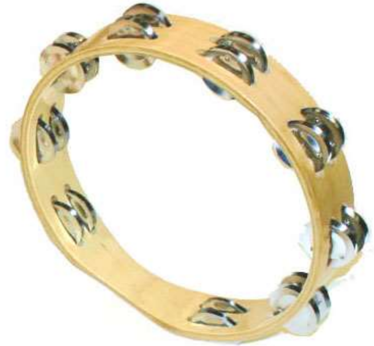
TAMBOURIN tambourin tambourin