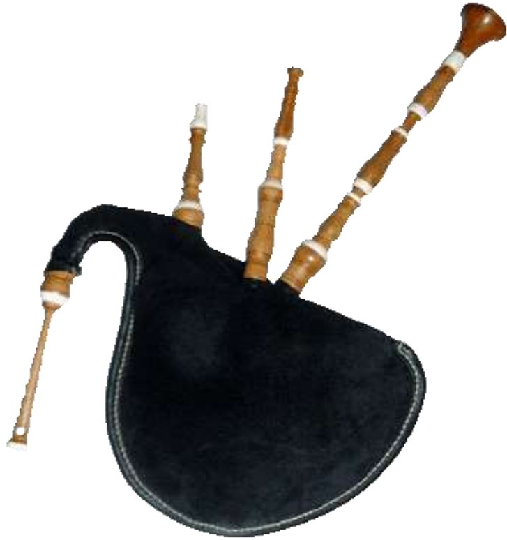
BINIYOU biniou biniou