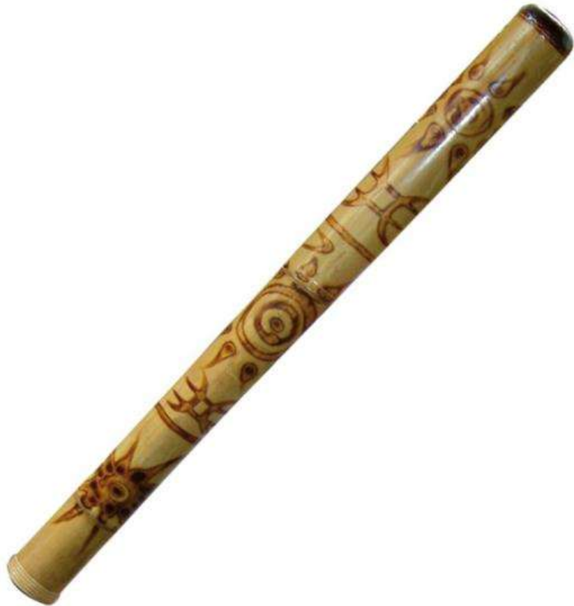
DIDGERIDOO didgeridoo didgeridoo