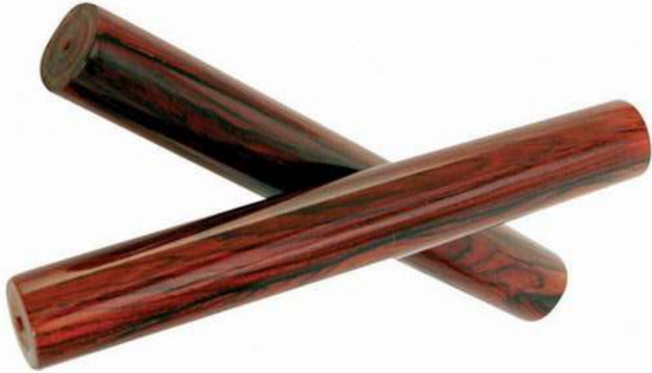
CLAVES claves claves