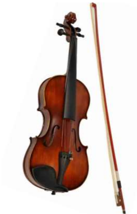
VIOLON violon violon