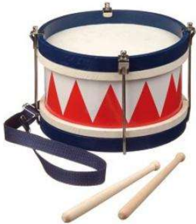
TAMBOUR tambour tambour