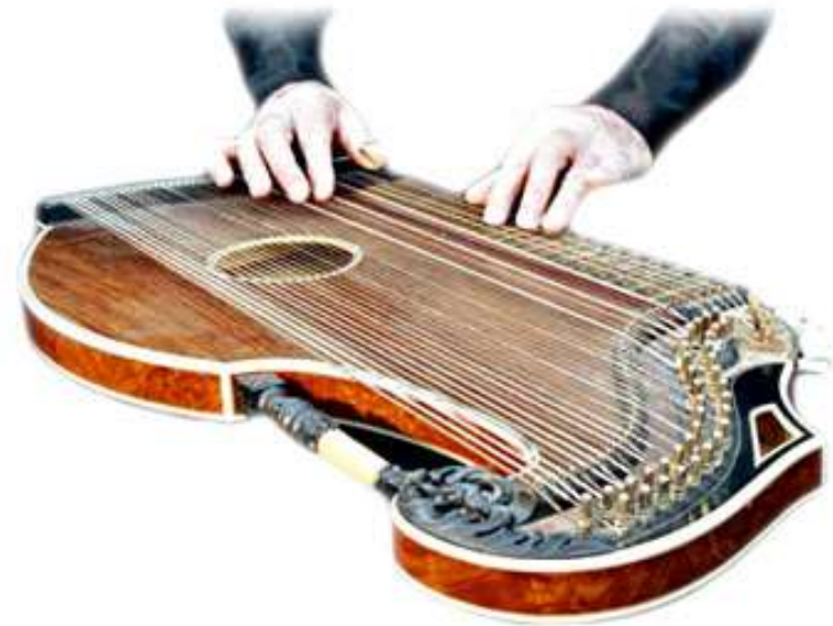
CITHARE cithare cithare