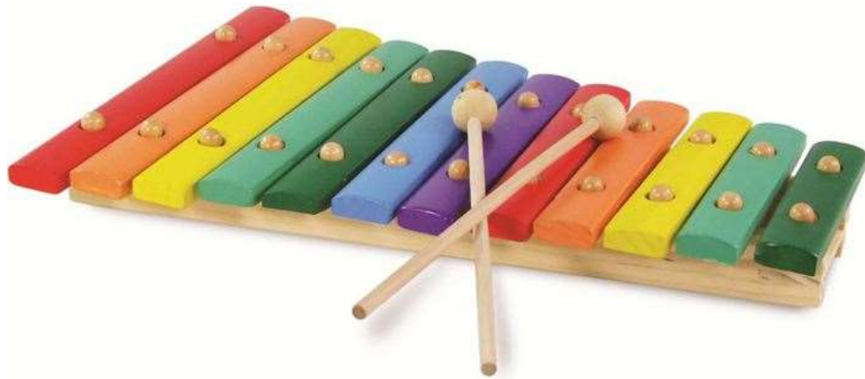
XYLOPHONE xylophone xylophone