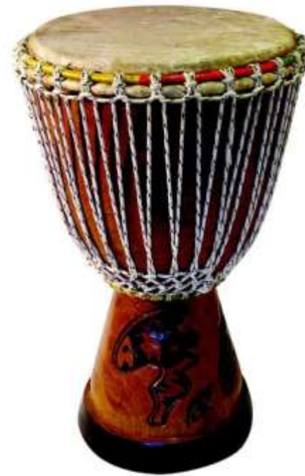
DJEMBE djembé djembé