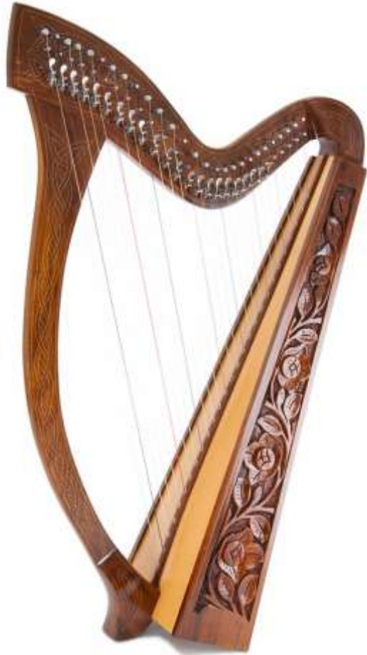
HARPE harpe harpe