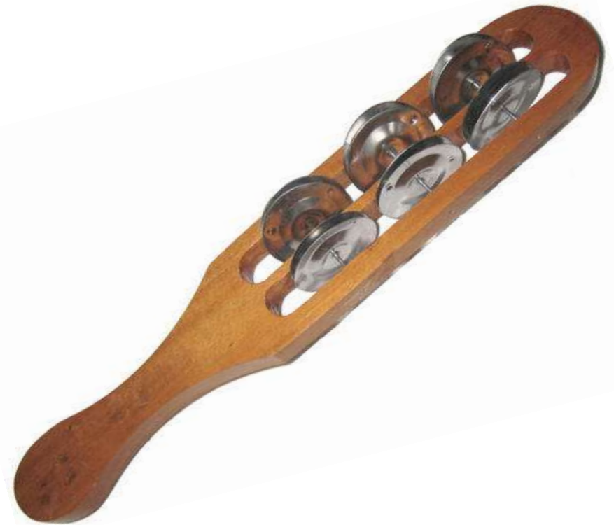
SISTRE sistre sistre