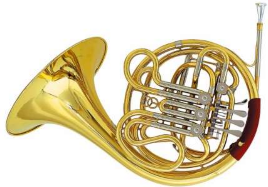
COR D'HARMONIE cor d'harmonie cor d'harmonie