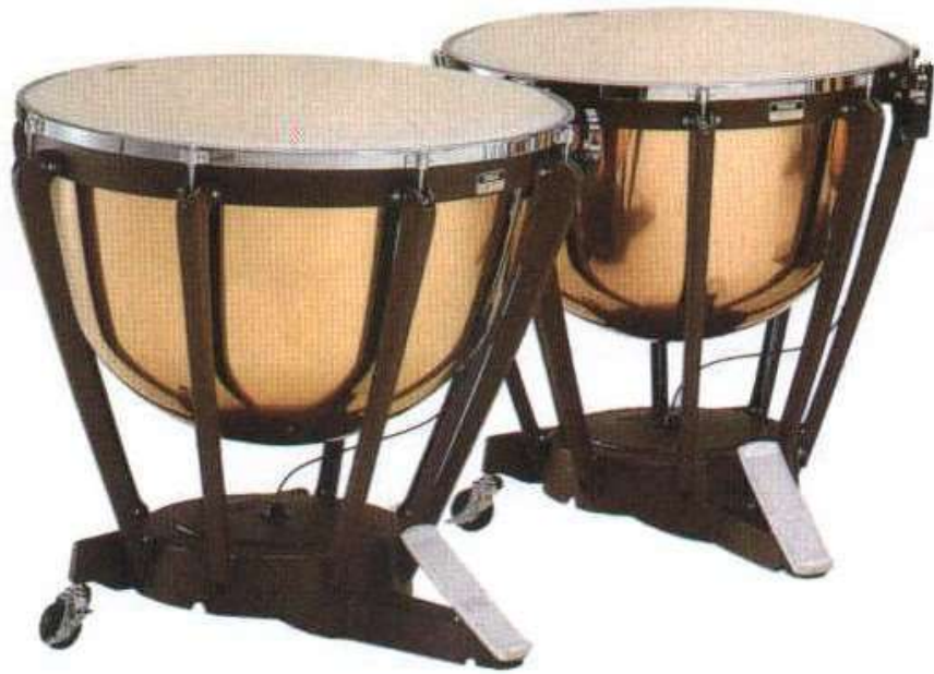
TIMBALES timbales timbales