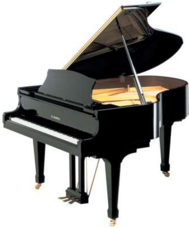
PIANO piano piano