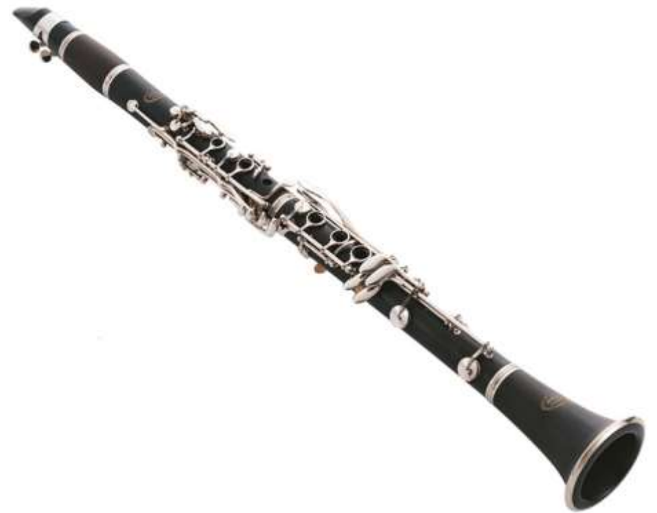
CLARINETTE clarinette clarinette