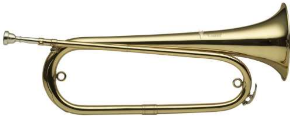
CLAIRON clairon clairon