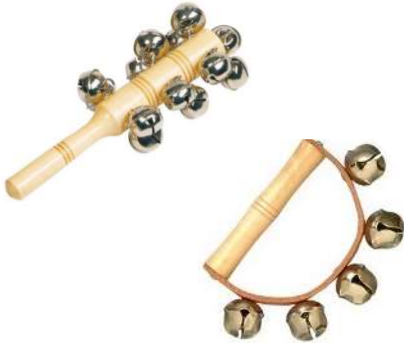
GRELOTS grelots grelots