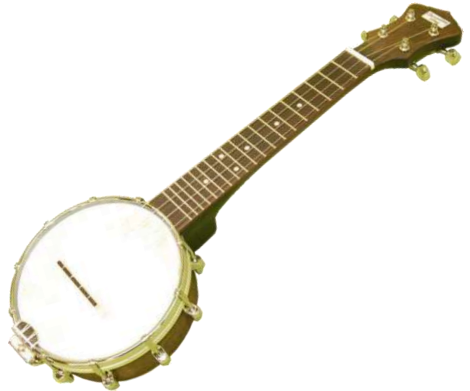
BANJO banjo banjo