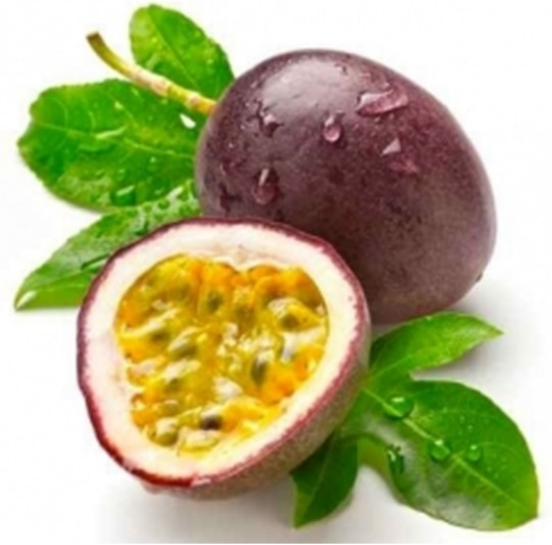
FRUIT DE LA PASSION fruit de la passion fruit de la passion