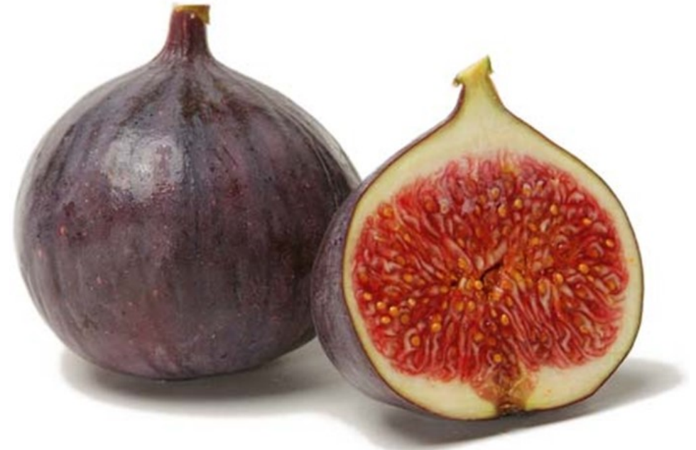
FIGUE figue figue