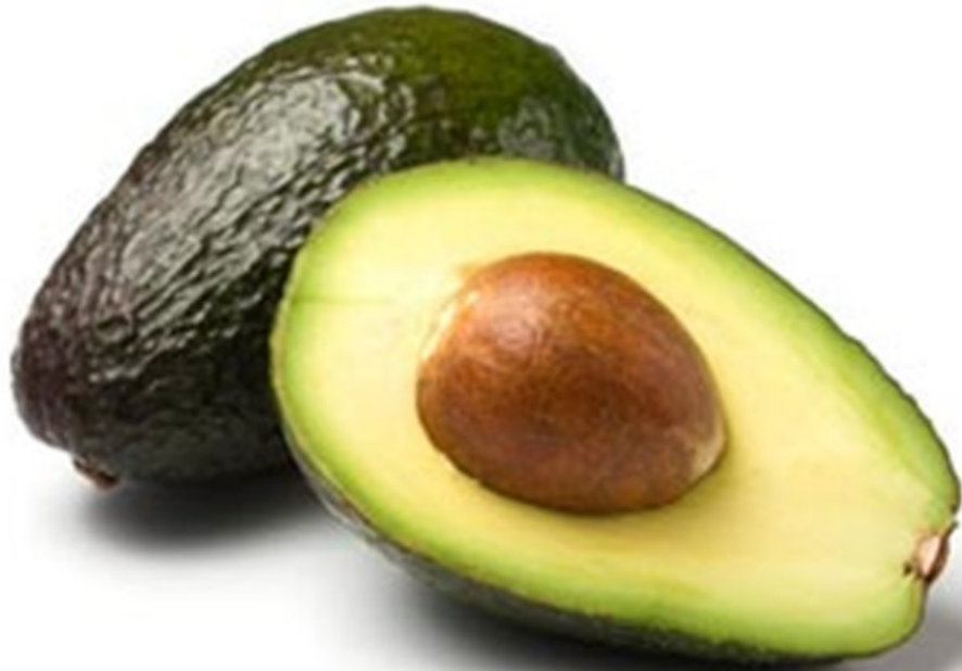
AVOCAT avocat avocat