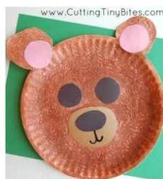
Fuzzy Brown Bear Craft