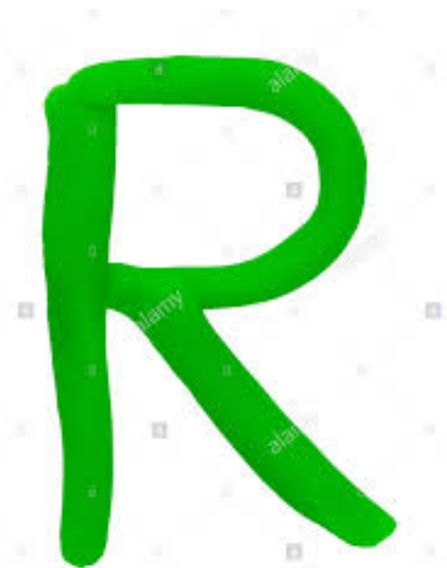
En pâte à modeler