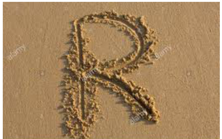
Sur le sol