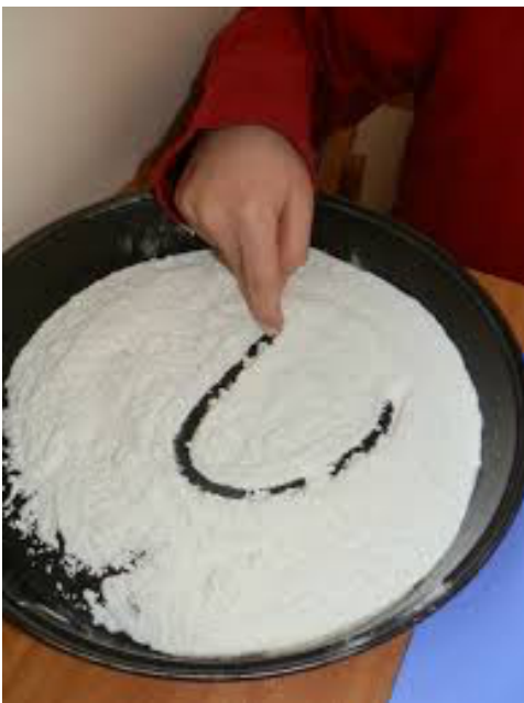
Dans la farine

A faire: avant d'écrire au stylo sur feuille, il vaut mieux faire travailler l'enfant sur plusieurs supports: la farine, la pâte à modeler, l'ardoise, une vitre embuées.... Montrer les 3 étapes pour écrire la lettre R, puis laissez-le essayer et s'entraîner à plusieurs reprises.