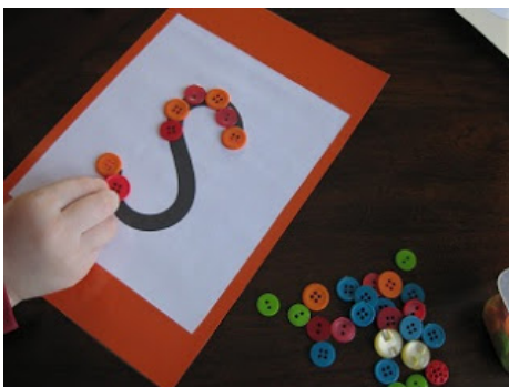
Repasser sur l'initiale avec des boutons