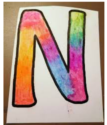
Colorier l'intérieur de l'initiale dessinée par vous même