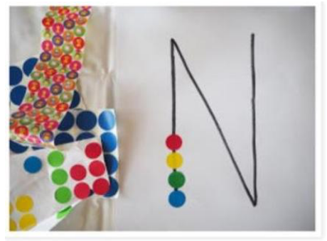
Repasser l'initiale avec des gommettes