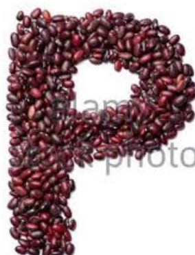
Repasser l'initiale avec des graines