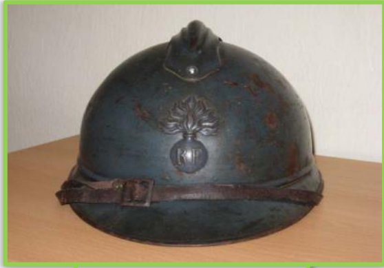
Un Casque Adrian de l'infanterie française

Amuse-toi à reproduire cet avion sur le quadrillage.