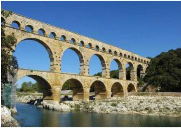
Pont du Gard