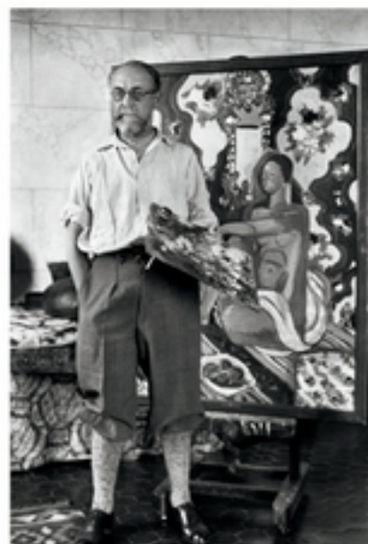
H. Matisse, vers 1930.

12 • Le fauvisme est une façon de peindre 19 qui est apparue vers le début du 24 vingtième siècle. Les peintures fauves 30 se caractérisent par des couleurs vives, 36 appliquées sur de larges surfaces, et 42 par des formes simplifiées. La couleur 47 « fauve », orangée, fait penser au 52 pelage de certains animaux sauvages, 59 comme celui de vifs félins par exemple.