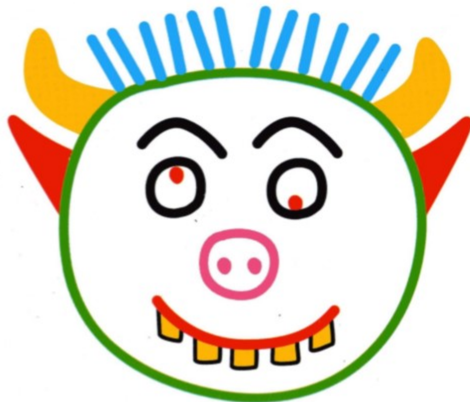
Boubou, le fils

Voilà ! Tu as terminé le portrait de Boubou, le fils des Affreux-Pas-Beaux !