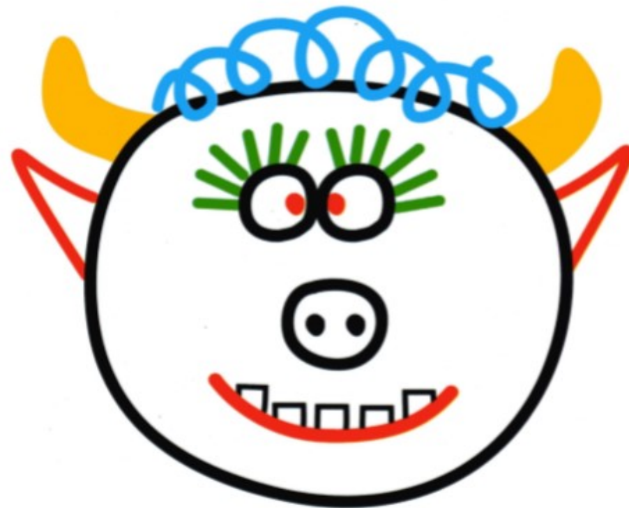
Babo, le père