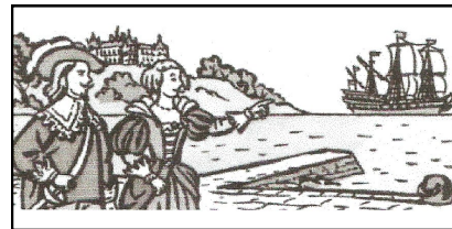
Les Temps modernes