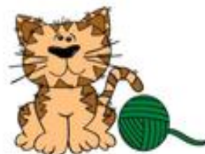
À CÔTÉ DE

Conseil : la meilleure manière d'apprendre ces mots, c'est de les faire avec son corps. (Vécu corporel, manipulation)