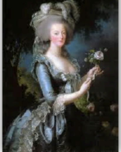
Doc 5 : Marie Antoinette

Louis XVI est le troisième petit-fils du roi Louis XV. Ses frères aînés étant morts, il devient dauphin, héritier du trône, au décès de son père en 1765. Son éducation politique est totalement négligée par son grand-père. Par contre il reçoit une forte éducation religieuse catholique et s'intéresse beaucoup à l'histoire et à la géographie. Il est aussi passionné par les activités manuelles et en particulier par la serrurerie, activité qui lui permet de s'isoler des intrigues de la Cour de Versailles. Sa femme, Marie-Antoinette d'Autriche, vit luxueusement et dépense beaucoup pour organiser des somptueuses fêtes.