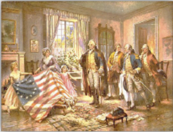
Doc 4 : l'indépendance des Etats-Unis

2 Relie les événements correspondants aux dates :