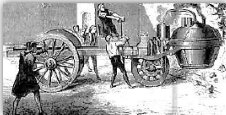
Doc 7 : Premier véhicule à vapeur de Cugnot : les freins ne fonctionnent pas encore bien !

2) Des idées nouvelles : Les philosophes* comme Voltaire, Montesquieu, Rousseau et Diderot s'opposent au pouvoir absolu du roi et aux inégalités. Ils demandent des réformes :