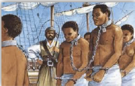
Doc 2 : les esclaves enchaînés et menacés d'être fouettés.