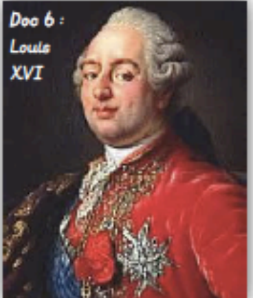
Doc 6 : Louis XVI