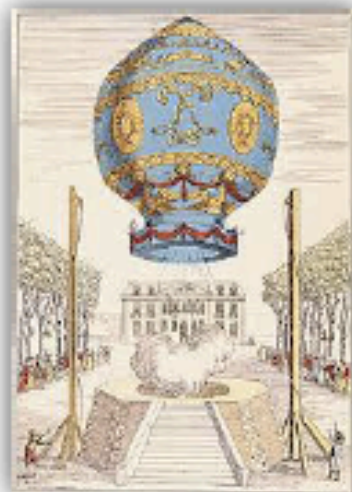
Doc 8 : Le 1 er ballon des frères Montgolfier il y a 200 ans