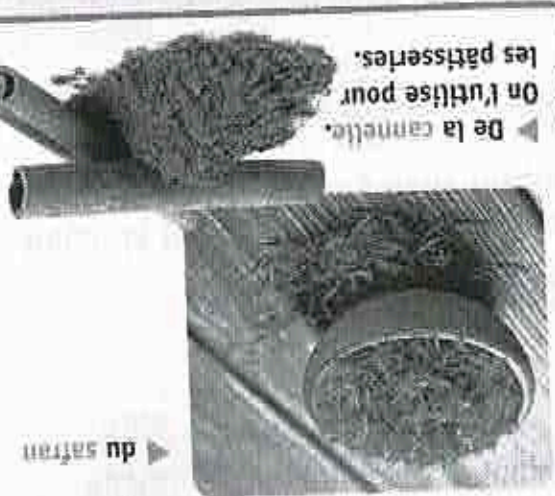
► La cuisine marocaine utilise beaucoup d'épices. Cela donne du goût, c'est très bon !