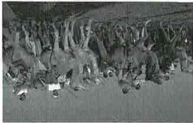
▲ Il y a même des courses de dromadaires.

Quand la cueillette des dattes est finie, une grande fête est organisée. Nous faisons un bon repas, qui commence souvent par des salades, comme le nezgali, une salade d'oignons avec des épices et du sucre. Puis ma mère et mes tantes apportent des couscous ou le tajine. Dans l'après-midi, nous mangeons des petites pâtisseries avec du thé vert.