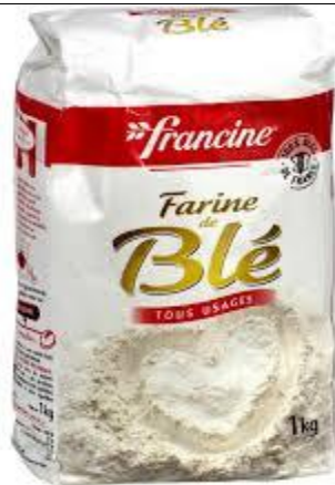
DE LA FARINE