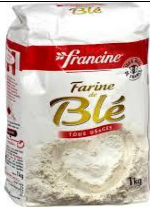
DE LA FARINE