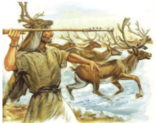
Chasseur de rennes à l'aide d'un propulseur

Progressivement, il développe ses talents de chasseur et s'attaque aux gros animaux tels que les bisons, les mammouths, les antilopes, les rennes.