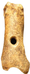
Un sifflet creusé dans une phalange de renne vieux d'environ 35 000 ans