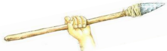
Utilisation d'une sagaie.

Aiguilles à chas en os pour coudre datées de 14 000 av. J.C