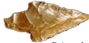
Pointe de flèche en silex

* propulseur : instrument sur lequel est installée une flèche ou une sagaie pour augmenter sa vitesse et sa précision.