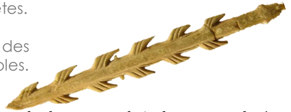
des harpons en bois de renne sculptés utilisés pour la pêche- daté d'environ 17 000 ans [Grand Palais.]