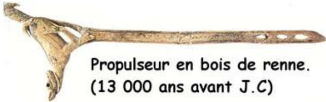
Propulseur en bois de renne. (13 000 ans avant J.C)

Il invente le propulseur* pour lancer les sagaies* avec beaucoup plus de force et beaucoup plus de précision.