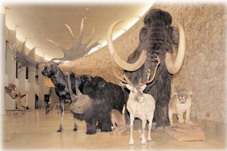
Musée de Préhistoire des Gorges du Verdon