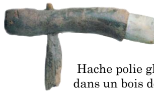
Hache polie glissée dans un bois de cerf, fixé sur un manche en bois daté de 5 000 ans.