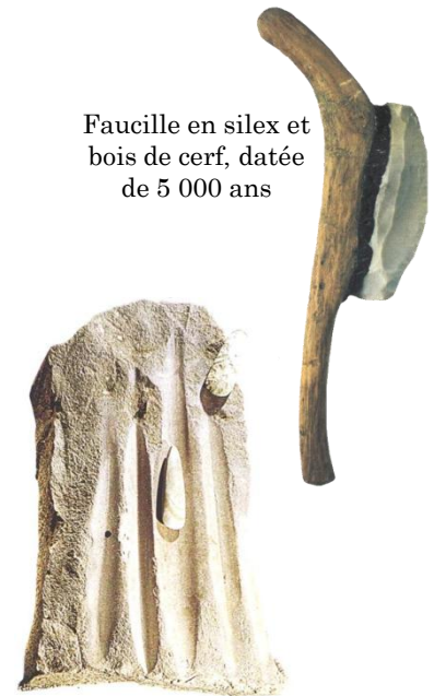
Faucille en silex et bois de cerf, datée de 5 000 ans