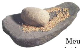
Meule en pierre, datée de 6 000 ans

Les outils se développent également, le silex est poli et devient plus coupant. Ils fabriquent des haches et des faucilles mais aussi des meules.