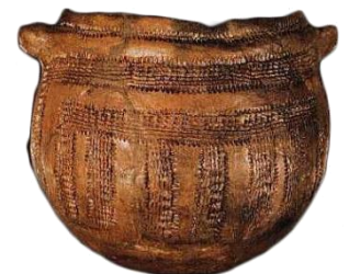
Vase-Espagne- [Musée Préhistorique de Valencia]

Ils permettent de stocker, transporter et conserver les aliments.