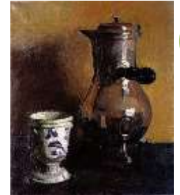
Albert Marquet La Cafetière 1902 (Musée des arts de Bordeaux)