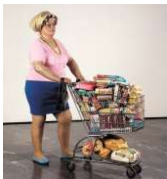
Hanson- Supermarket Lady 1969