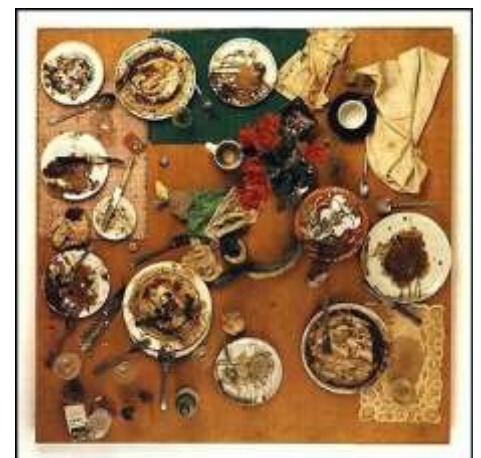
SPOERRI Daniel (1930), Tableau-piège, 1965, Zurich, vaisselle et repas sur table