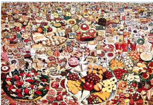
ERRO (1932), Foodscape, 1962-64, huile sur toile, 200x300 cm, Stockholm

Plusieurs artistes témoignent de la société actuelle, de la consommation excessive.