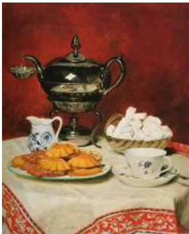
Albert Anker 1896