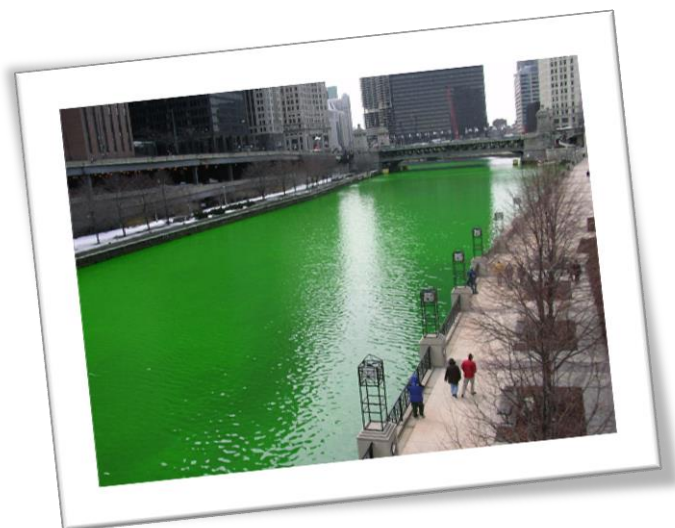
La « Chicago River » est teinte en vert tous les ans à l'occasion de la Saint-Patrick.