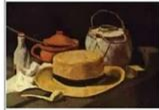
Nature morte au chapeau de Paille de Vincent Van Gogh