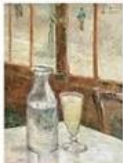
Assenzio de Vincent van Gogh