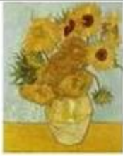
Les Tournesols de Vincent Van Gogh