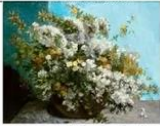
nature morte de Gustave Courbet