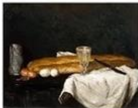
Still life w.bread and egg... de Paul Cézanne