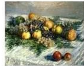
nature morte avec des poir... de Claude Monet