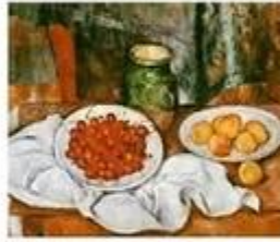
Nature morte avec cerises ... de Paul Cézanne