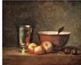
nature morte I de Jean-Baptiste Siméon Chardin