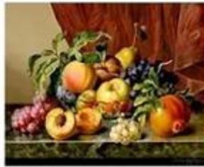
nature morte de Anton Hartinger