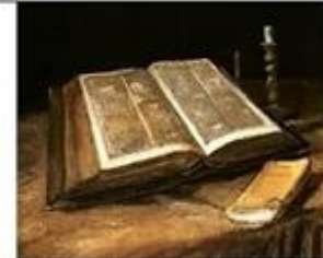
nature morte avec la bible de Vincent van Gogh