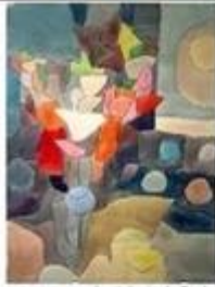
nature morte de gâteaux de Paul Klee