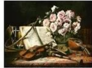
Nature morte avec instrume... de Charles Antoine J. Loyeux