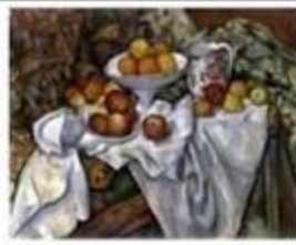
Nature morte aux pommes et aux oranges de Paul Cézanne