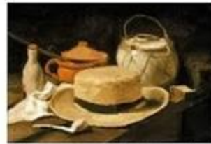
Nature morte avec le chapeau... de Vincent van Gogh