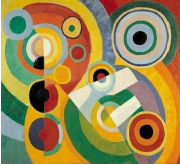
Joie de vivre, Robert Delauney

Des cercles/des ronds dans les œuvres d'art : Delauney et Kandinsky