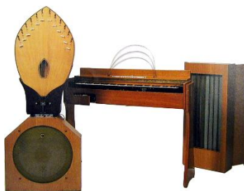
les ondes Martenot