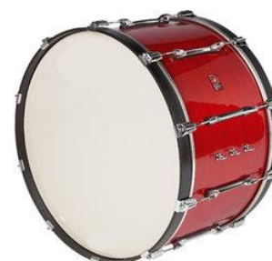
la grosse caisse