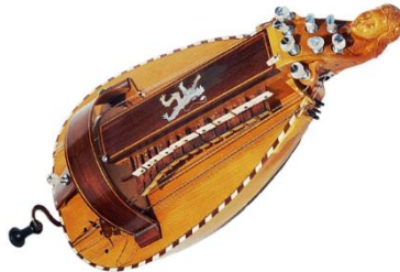
la vielle à roue