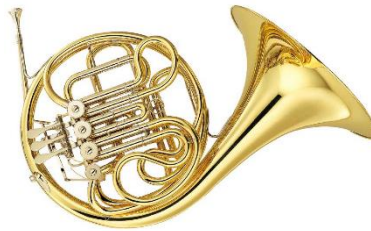
le cor d'harmonie