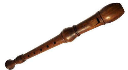
la flûte à bec