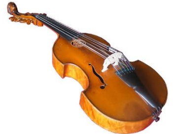
la viole de gambe