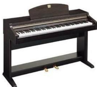
le piano électrique