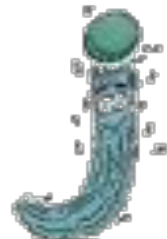
le jet d'eau