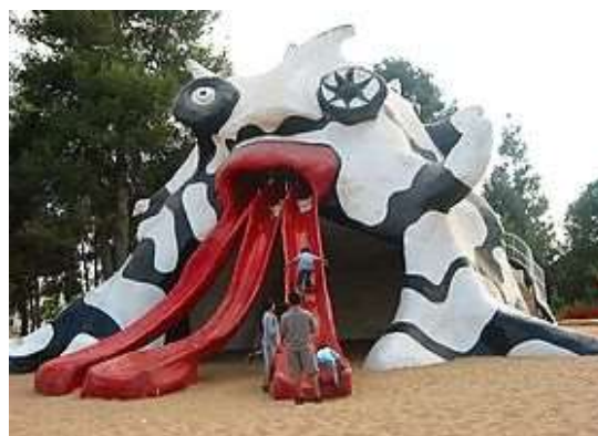
Le Golem - Israel