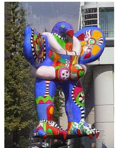
La fontaine de jouvence - Allemagne