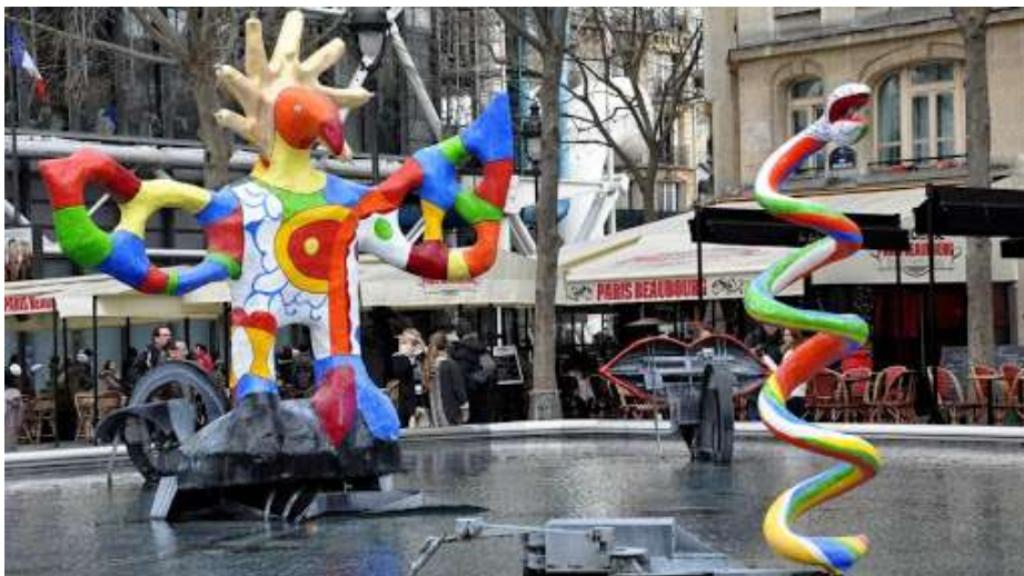
La fontaine Stravinsky - Paris