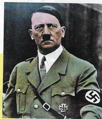
Adolf Hitler (1889-1945).

(1) Les communistes : les personnes qui veulent que les moyens de production (les machines, les usines, les champs) appartiennent à tous pour supprimer les inégalités de richesse.