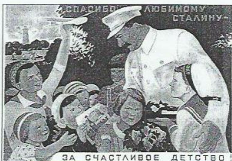
Doc. 4 Affiche officielle, Staline « petit père des peuples », années 1930. « Grâce à notre bien-aimé Staline, nos enfants grandissent dans la joie et la prospérité. »

6. Comment sont représentés Hitler et Staline sur ces deux affiches ?