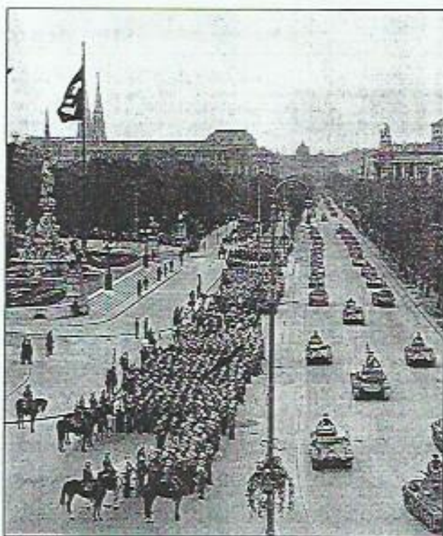
Doc. 3 En mars 1938, Hitler rentre dans Vienne et annexe l'Autriche.