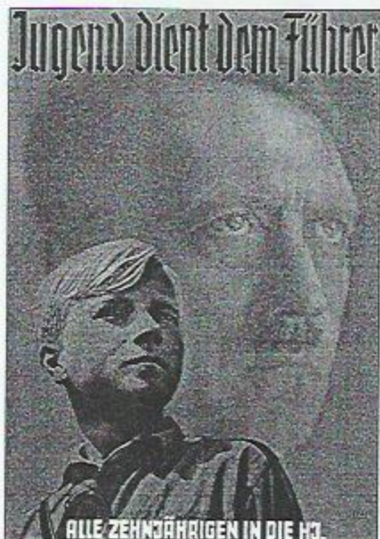
Doc. 3 Affiche de propagande allemande des années 1930-1940. Extrait de Der Pimpf , magazine destiné aux Jeunesses hitlériennes. « La jeunesse avec Hitler. Ici les enfants de 10 ans dans les Jeunesses hitlériennes. »