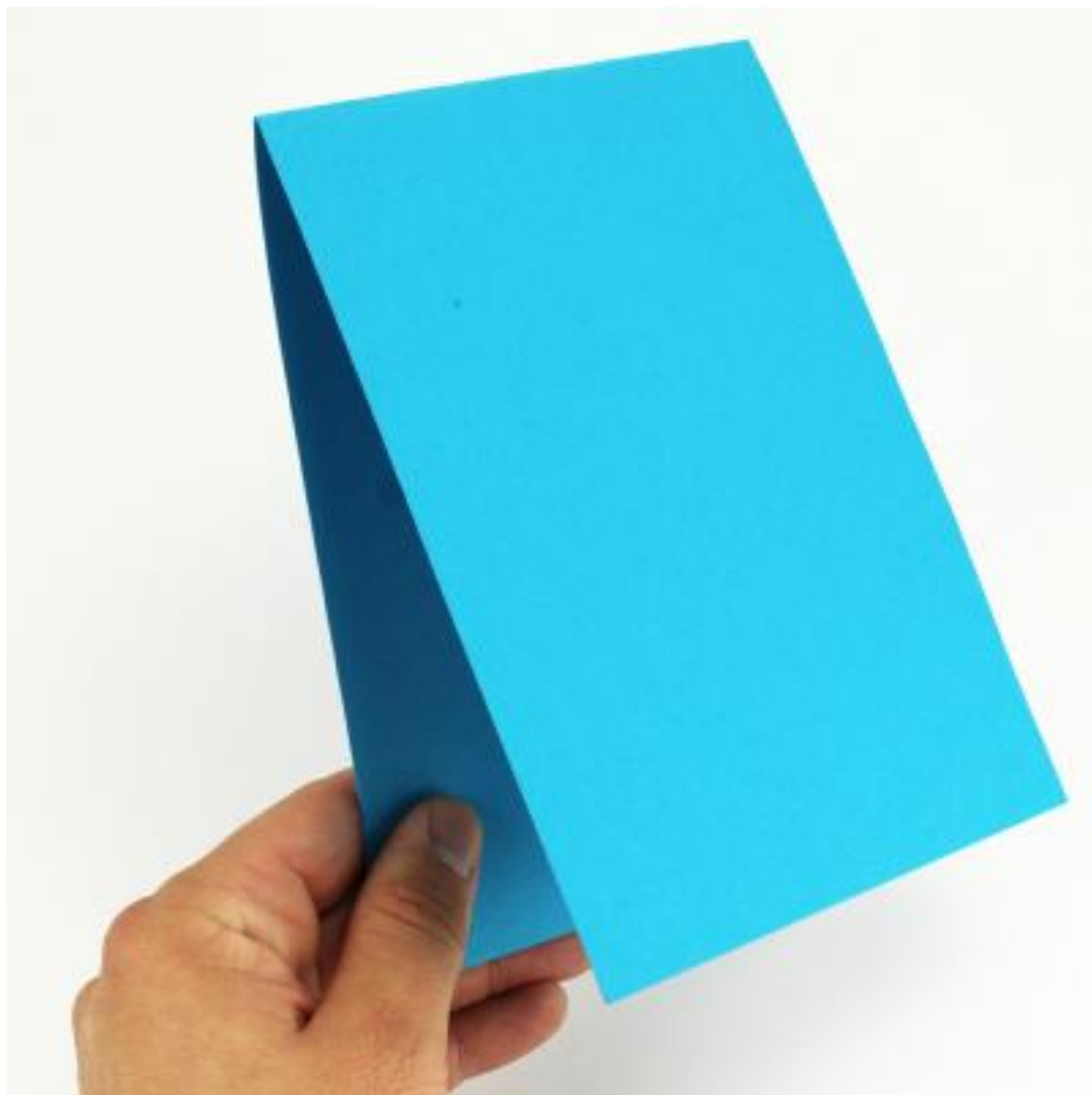
Etape 3 : Plier