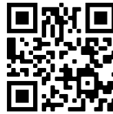
Le corbeau et le renard

8) Recopie la fin de cette fable dans ton cahier de poésie :