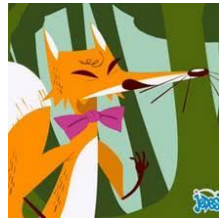
Le corbeau et le renard

7) Regarde à nouveau la vidéo suivante :