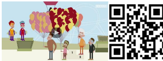
La soustraction posée(1)

3) Regarde à nouveau la vidéo suivante :