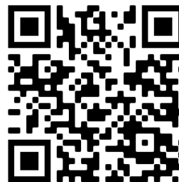
Le sens des multiplications