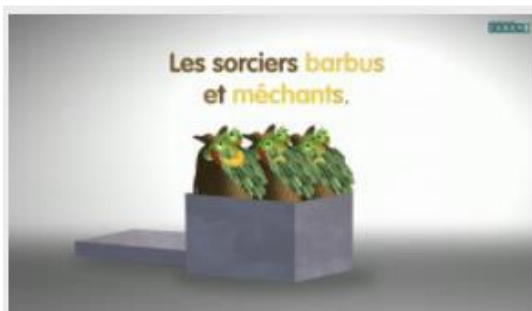
Les accords simples avec le nom