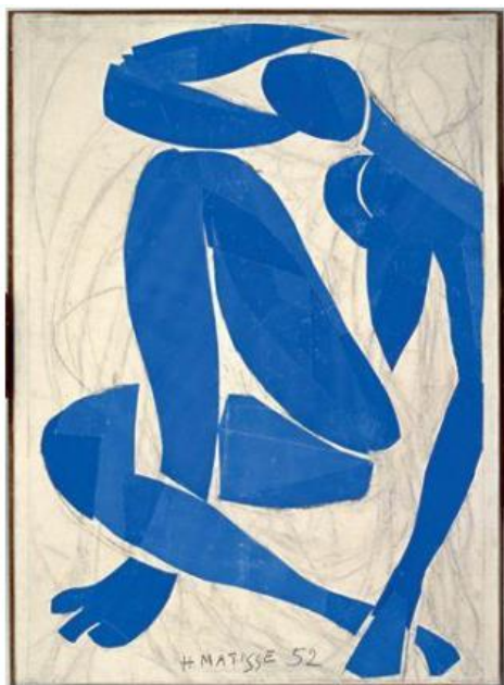
Le Nu bleu IV d'Henri Matisse de 1952.

2-Langage- Lire et comprendre une oeuvre- Développer un regard critique- Exprimer ses émotions